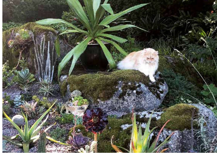
I maj varje år sätts succulenter och kaktusar ut i en större plantering i en singelbädd. Som kantväxt används echeveria. Bakom katten Zirkus står den nu mer än 50-åriga agaven, ursprungligen ett litet skott från parets första resa till Sicilien.

ens vårfrost, som är ett gissel i tider av starkt fluktuerande temperaturer under våren. Den mest kraftigväxande är brooklynmagnolian, M. x brooklynensis 'Yellow Bird', som har ljuvligt mångula blommor, och blommor lite senare. En 15-årig sommarmagnolia Magnolia x wieseneri 'Swede Made' har skadats svårt men har blad, även om de är betydligt mindre än normalt och ser trötta ut. Vi får se vad en hård nedskärning kan ge för effekt. Tyvärr har fyra unga magnolior dött medan fyra andra nya klarat sig utan skador. Gemensamt för dem som klarat sig är att de har varit minst ett år äldre och mer välutvecklade, när de planterades ut. Jag köper yngre på våren och odlar upp dem till större och kraftigare plantor och planterar vanligtvis inte ut dem förrän året därpå.