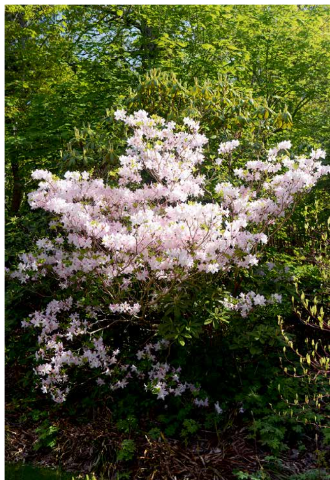
Den kanske finaste växten från växtinsamlingen i Sydkorea på 1970-talet är koreansk azalea, Rhododendron schlippenbachii . Uppdragen från ett mycket litet frö har detta paradexemplar hunnit bli över 2,5 meter.