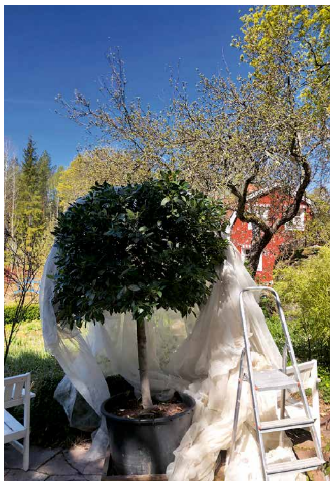
Dags för acklimatisering av lagerträdet, Laurus nobilis , på den slutliga placeringen, kalkstensterrassen. Framför allt gäller det att skydda det mot den starka solen. Utan vit fiberduk blir det lätt brännskador. På hösten skördar vi lagerblad i samband med att trädet ändå måste toppas, för att få plats i garaget.