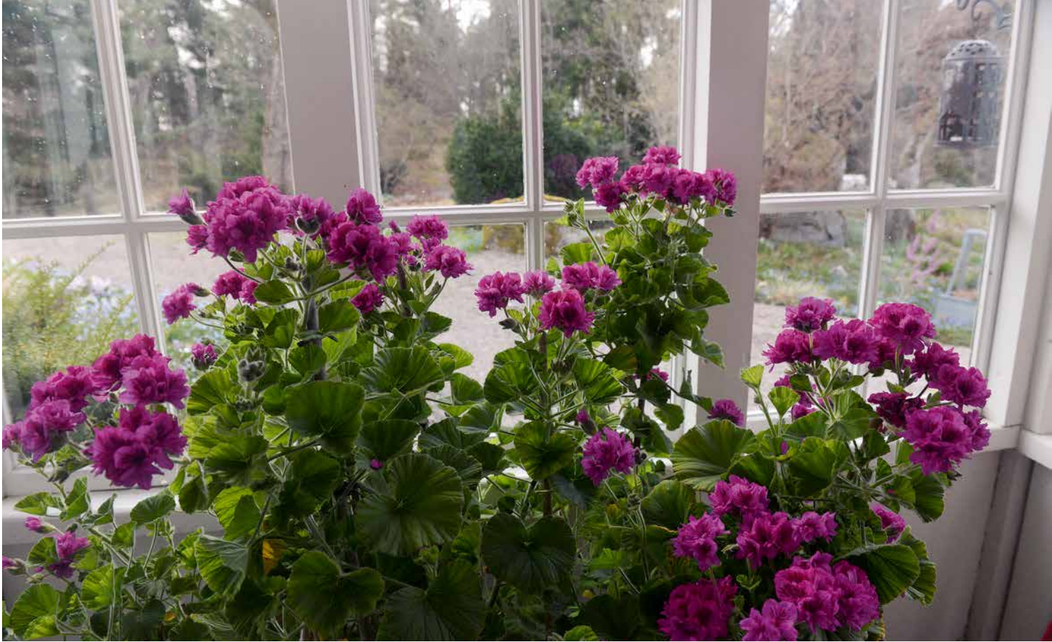
Hjälmpelargon, Pelargonium cucullatum 'Flore Plenum', ett mer än meterhögt övervintrande exemplar i entréverandan, under maj månad. Denna planta minner om buskar i naturen på Taffelberget i Sydafrika, fantastiska upplevelser.