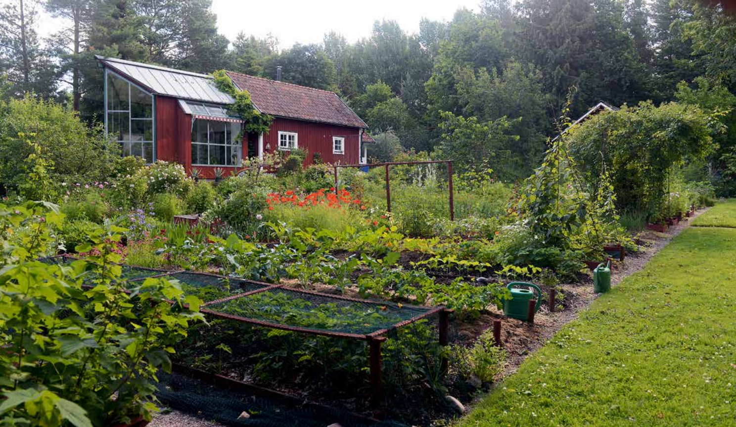
Försommar i köksväxtlandet.