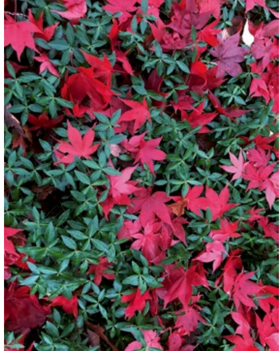
Vackra höstlöv från japansk lönn, Acer palmatum 'Osakazuki', som gör sig särskilt bra i mattor av städsegröna växter som vintergröna, Vinca minor , och murgröna.