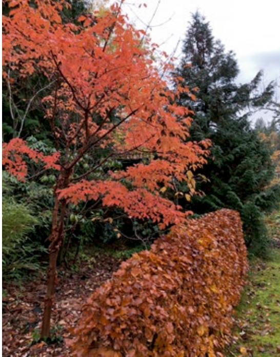
Kopparlönns, Acer griseum , och bok, Fagus sylvatica , tillhör de sista som höstfärgar i trädgården och som de gör det! Det nästan brinner i lövverket.